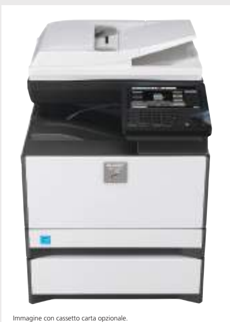
Immagine con cassetto carta opzionale.

CONNETTITI AL CLOUD CON I MODULI OPZIONALI SHARP OSA