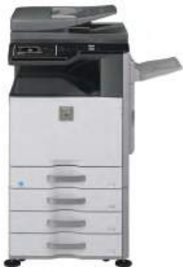
Unità Base Vassoio uscita superiore Stand con 3 cassette da 500 fogli