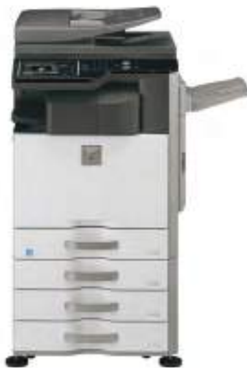
Unità Base Vassoio uscita superiore Finisher interno Stand con 3 cassette da 500 fogli