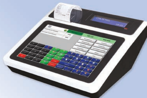
Sistema compatto all in one