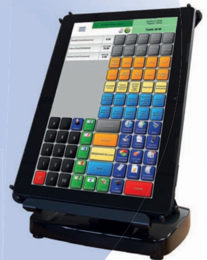
Sistema versatile da 13"