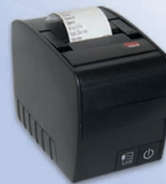
Stampante non fiscale