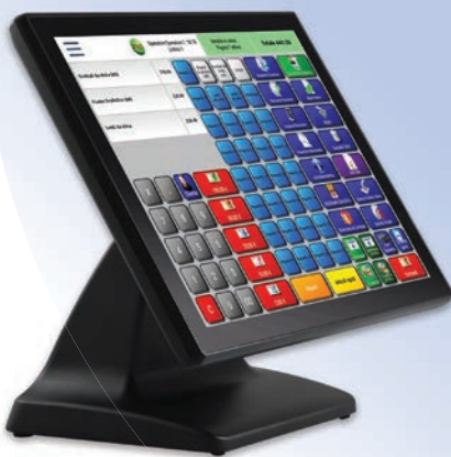
Sistema completo all in one