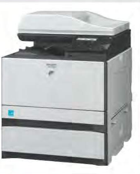
CASSETTO CARTA OPZIONALE DA 500 FOGLI