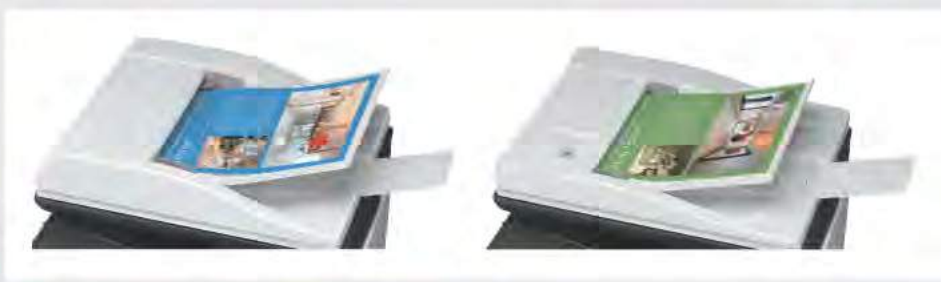
ALIMENTATORE DEGLI ORIGINALI