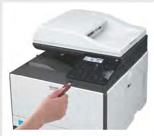
PORTA USB FRONTALE

Entrambi i modelli hanno in dotazione una comoda porta USB per stampare e scansare facilmente da una chiavetta. Inoltre, puoi connettere MX-C300W a una rete wireless e stampare direttamente dal tuo smartphone o tablet.