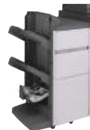
Finisher pinzatura sella