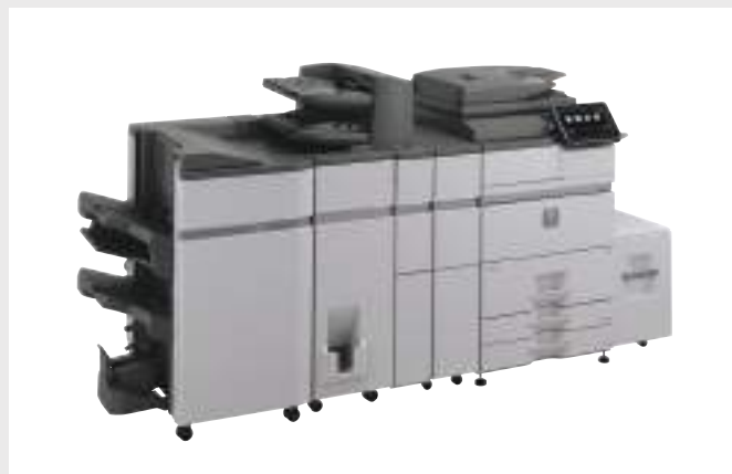
MFP A3 PRODUTTIVE E AFFIDABILI

Tutto è stato progettato per una sempre maggiore affidabilità. Persino le maniglie dei cassette offrono una presa più ergonomica!