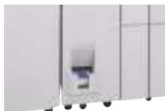
Unità di piegatura

Necessaria se si installa MX-CF11 e MX-RB13 non è richiesto. Consente la piegatura a Z, a lettera, la doppia parallela e la piegatura centrale