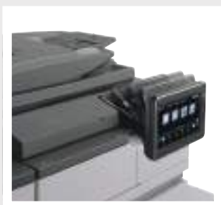
MAGGIORE VISIBILITÀ CON IL PANNELLO ORIENTABILE

Il pannello LCD a colori da 10.1", con interfaccia multi-touch e tecnologia finger-swipe ti consentirà il controllo diretto a ogni funzione e caratteristica, guidandoti semplicemente in ogni operazione. Lo schermo, orientabile per una maggiore visibilità, può essere utilizzato anche per accedere a internet. E non è tutto.