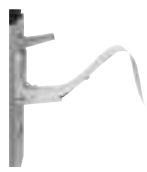
Estensione del vassoio bypass