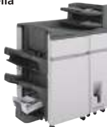
Finisher pinzatura sella

(capacità uscita 4.000 fogli, pinzatura 100 fogli) A3 - B5 (offset/pinzatura), SRA3 - A5R (non offset) Vassoio superiore: 1.500 fogli* Vassoio centrale: 250 fogli* Vassoio inferiore: 2.500 fogli* Capacità pinzatura 100 fogli* (frontale, retro o pinzatura a due punti) Vassoio pinzatura a sella: 5 fascicoli (16-20 fogli), 10 fascicoli (11-15 fogli), 15 fascicoli (6-10 fogli), 25 fascicoli (1-5 fogli). Massimo 20 fogli per fascicolo.