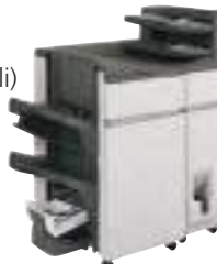
Finisher per pinzatura a sella

Richiede MX-RB18. Non installabile con MX-FN21.