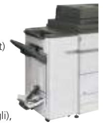
Finisher per pinzatura a sella

(capacità uscita 2K fogli, pinzatura 50 fogli) A3-B5R (offset/pinzatura), A3W-A5R (non offset) Vassoio superiore: 2.000 fogli* Vassoio inferiore: 250 fogli* Capacità pinzatura: 50 fogli* (frontale, retro o pinzatura a due punti) Vassoio pinzatura a sella: 10 fascicoli (11-15 fogli), 15 fascicoli (6-10 fogli), 30 fascicoli (2-5 fogli). Non installabile con MX-FN24. Solo per MX-M904.